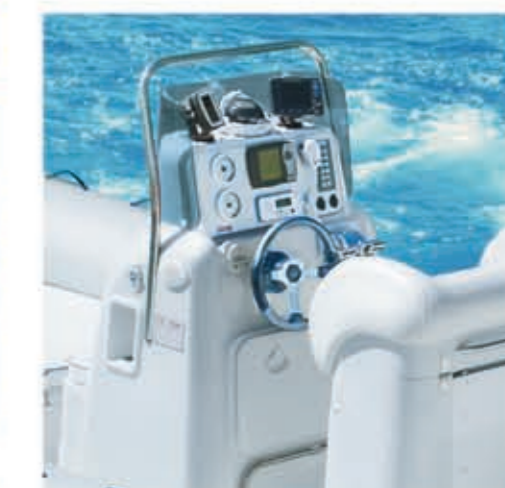
Ampio spazio per la strumentazione di bordo