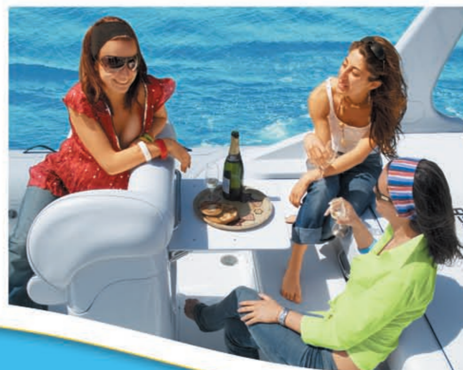
Tavolino abbattibile e dinette di poppa.