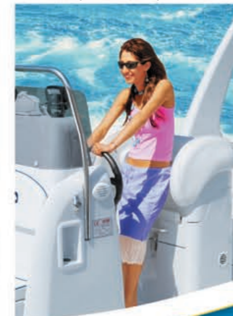
Consolle di guida e sedile pilota.