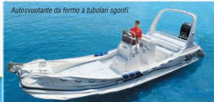
Autosvuotante da fermo a tubolari sgonfi